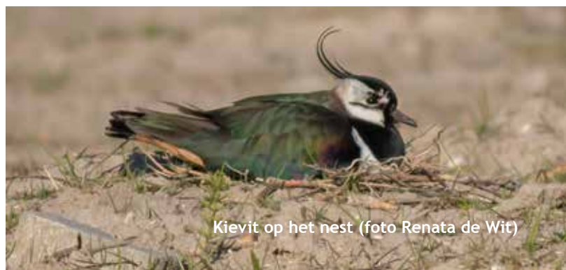
Kievit op het nest