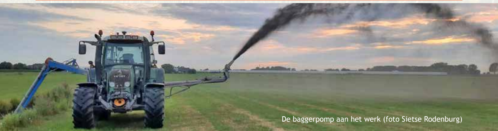
De baggerpomp aan het werk

Ook interesse in het pakket 'Baggeren met de baggerpomp'? Neem contact op met uw poldercoördinator.